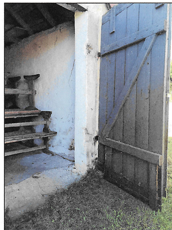
BRAMA I DETAL POSADZKI